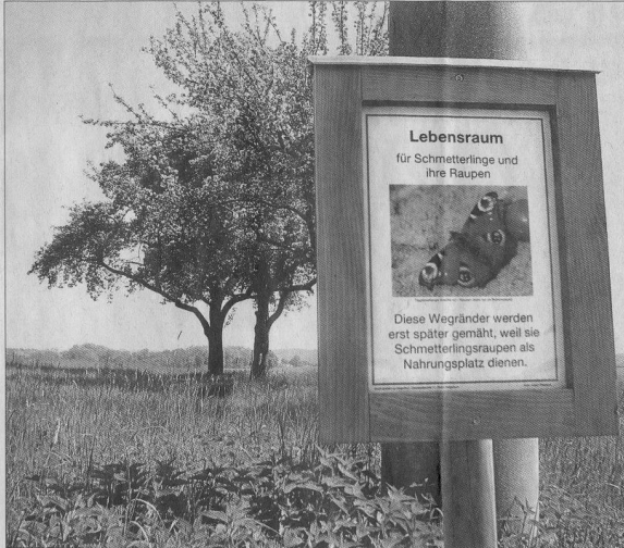
Hier haben Schmetterlinge Vorrang, deshalb wird nicht gemäht: Schilder erklären seit neuestem an einigen Stellen, warum hier die Brennnesseln wachsen dürfen.

Der größte Feind des Schmetterlings ist aber der